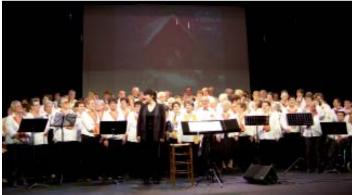
Plus de 100 choristes Aînés Ruraux rassemblés pour le plaisir de chanter.

La toute nouvelle commission culture et découverte de la Fédération départementale des Aînés Ruraux a parfaitement réussi l'une de ses premières actions.