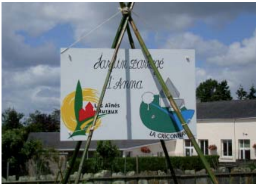
Le jardin d'Anna, un moyen de développement et d'échanges pour les clubs.

L'idée d'un jardin partagé a germé au cours d'une réunion des Aînés ruraux en janvier 2012. Sa réalisation a pu se faire grâce à l'appui de la municipalité par la mise à notre disposition d'une parcelle au milieu du bourg.