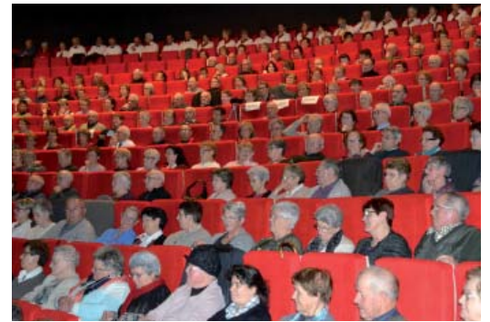
Le public conquis par la qualité de la prestation.