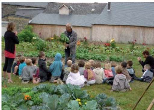
Le jardin : lieu d'échanges inter-générationnel.