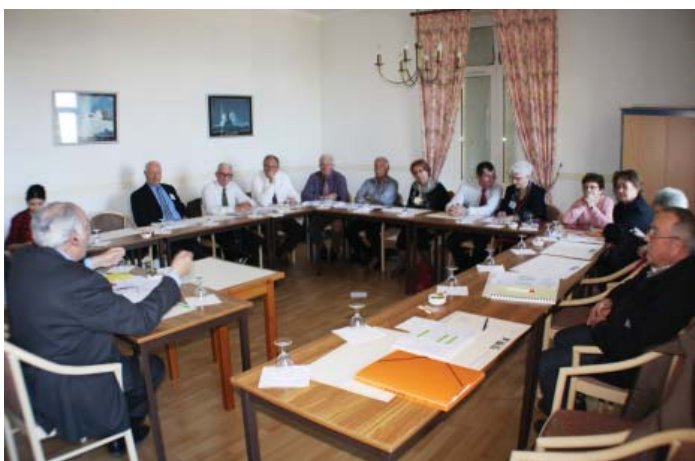
Travaux en groupe lors du séminaire au Croisic

Le site internet de la fédération départementale va évoluer. La présentation faite lors du séminaire fait apparaître des adaptations répondant mieux au