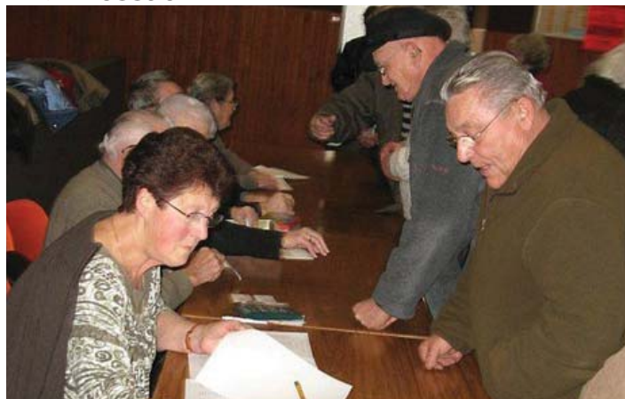
Accueil à l'Assemblée générale