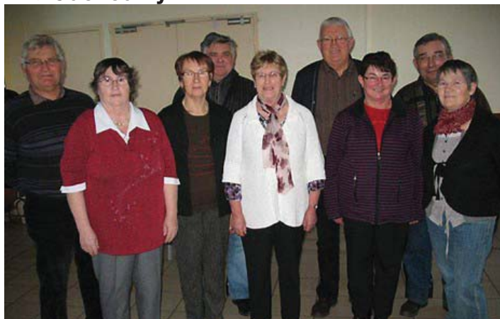
Les Aînés de Guénouvry rejoignent la fédération 44