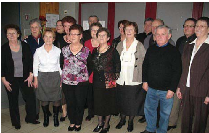
Après l'Assemblée générale