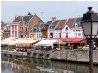
Les quais de la Somme à Amiens