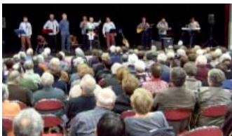
Les chants marins

La Solidarité Madagascar avait organisé pour la première fois à Ligné, un après midi concert, le 17 novembre. Plus de 200 personnes sont reparties enthousiasmées de