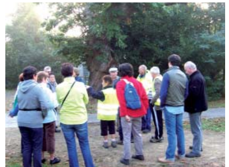
Explications devant les châtaigniers