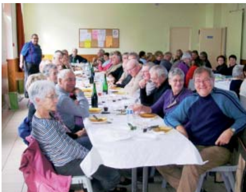
Dégustation après la cueillette

Mardi dernier 16 Octobre, l'association des Aînés de Guénouvry accueillait les autres clubs du canton pour une journée découverte et dégustation de champignons.