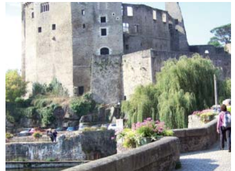
Arrivée au pied du Château de Clisson