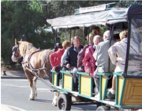
En calèche, dans les rues de la Rochelle

Le 1 er octobre 2012 à La Rochelle : une super journée Cette journée était organisée par les Aînés Ruraux du secteur du Vignoble et de Vieillevigne.