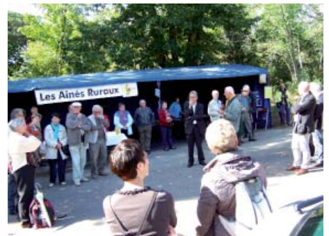
Moment de convivialité au retour de la Marche des châtaigniers