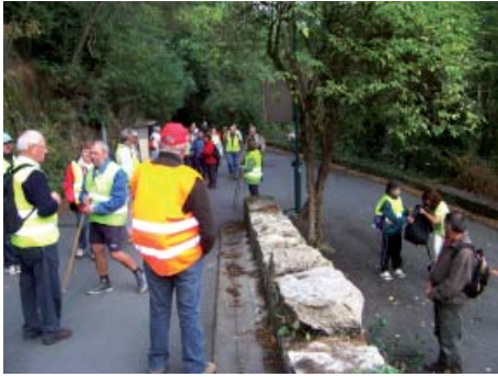
En marche vers les Chemins de Compostelle