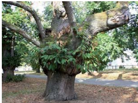
Un arbre magnifique