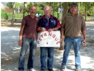
Nos valeureux représentants

Lors de la finale nationale du concours de pétanque le département était représenté par le club AMIRA d'Ancenis.