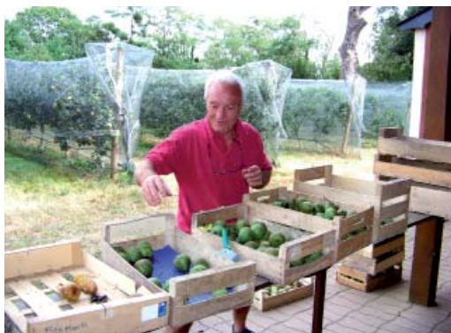
Des bénévoles engagés

Les Aînés Ruraux de Loire-Atlantique entretiennent ce précieux patrimoine végétal cultivé. Créé il a plus de 20 ans, et situé à quelques pas du centre ville de Nort-sur-Erdre. Ce patrimoine a été constitué collectivement. Ses créateurs et ses acteurs actuels en ont fait un lieu unique en son genre pour le maintien de la biodiversité paysanne.