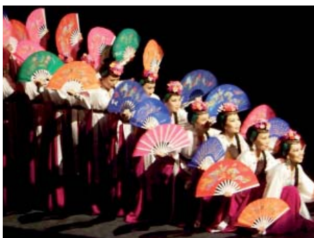
Retour sur le spectacle « L'Himalaya au Pays du Soleil Levant »