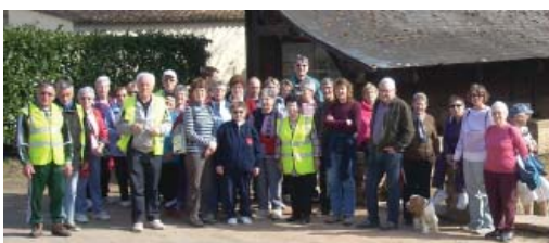
Heureux de se retrouver plus nombreux...

Le 15 mars 2012, Saint-Père-en-Retz accueillait les marcheurs de Moutiers-en-Retz. Les 37 participants à cette marche ont apprécié le circuit touristique dans notre