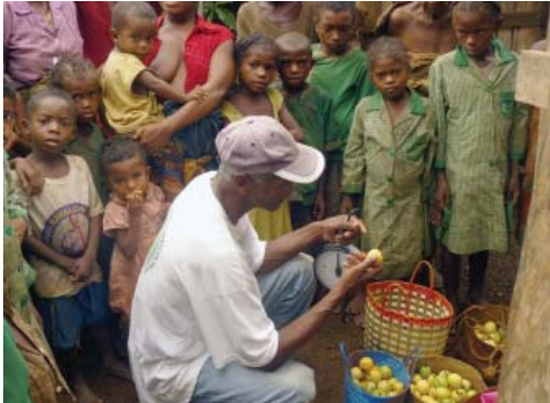
Au marché, sous le regard d'enfants affamés

La Solidarité de proximité, c'est bien, mais pensons aussi à nos frères de Madagascar... Alors que nous avons l'embarras du choix dans nos achats du quotidien et même du superflu, les Malgaches se contentent du riz comme plat principal. Chercher l'eau au puits tous les jours n'est