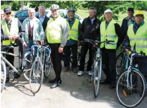
Près pour le départ

Vendredi 22 juin, venue pour la plupart à bicyclette jusqu'à la salle polyvalente de La Rouxière, une quarantaine de varadais a été accueilli par le club local.