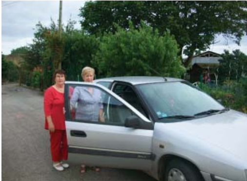
Une organisation souple et efficace

Dans nos campagnes, nous constatons que les personnes sont de plus en plus isolées en particulier les personnes âgées. C'est le cas dans notre section de Guénouvry, où l'on remarquait que des habitants privés de moyens de déplacement devaient fréquemment faire appel aux